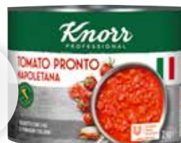
KNORR Pronto Napoletana Tomatensauce stückig, 6 Dosen à 2 kg/Karton 5,99 €/kg | 71,94 €/Karton