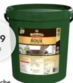
ROUX Klassische Mehlschwitze „hell“ Bindemittel, trocken, o.d.Z., 10 kg/Eimer 79,90 €/Eimer