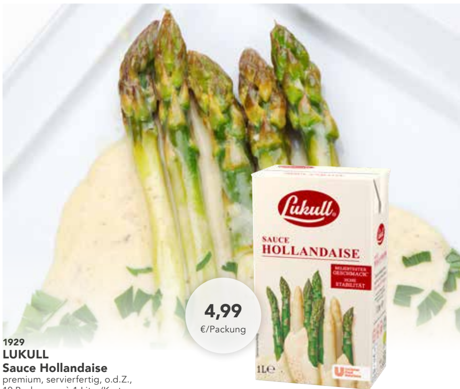
1929 LUKULL Sauce Hollandaise premium, servierfertig, o.d.Z., 10 Packungen à 1 Liter/Karton 49,90 €/Karton