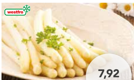
23905 Stangenspargel weiß Dicke: 16 - 22 mm, Länge: 17 cm, 10 x 1000 g/Karton