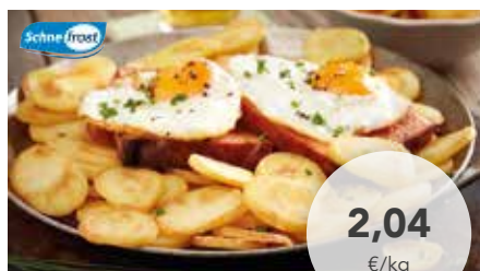
1021 Bratkartoffeln Scheiben hergestellt aus kleinen Qualitätskartoffeln und ungehärtetem, 100% pflanzlichem Fett, schnell zuzubereiten, 4 Beutel à 2,5 kg/Karton 5,10 €/Beutel | 10,20 €/Karton